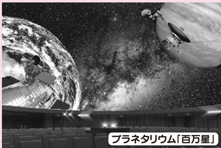
プラネタリウム「百万星」

いしかわ子ども交流センター 金沢市法島町11-8 TEL:076(243)6501