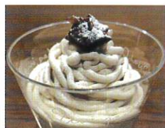
とうふ伝好 伝好の豆腐もんぷらん

夕食やデザートタイムには白山市おススメの食べ物が登場するのも一つのお楽しみ！ 海と山を擁する自然豊かな地が育んだ美味しい食材で白山市の魅力に触れてください♪