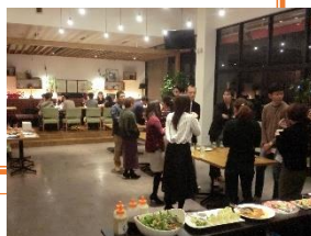
婚活イベントの様子

また、あえて婚活という名を出すことで真剣に結婚を考えている人が集まるようにしているほか、チラシには前年度の実績（成立カップル数）を公表するなど参加者の不安を和らげるよう工夫。