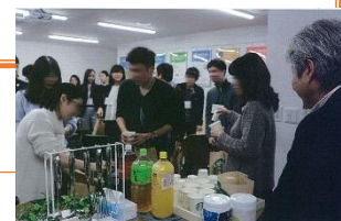
参加した交流会の様子

その他の取組として、 アドバイザー自身が「縁結びist」として活動されており、従業員を含め、独身者の結婚を後押ししている 。