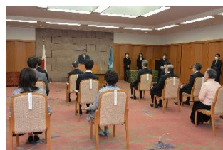
いしかわ婚活応援優秀企業知事表彰式