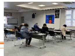
七尾交流サロンの様子

その他の取組として、財団に「縁結びist」制度の七尾交流サロンとして会場を無償提供している。これまでには若者の地元定着化を図り地域に活力を与えることを目的に「のとしんNAC（ナック：Nice Angel Center）」を発会し、独身男女向けのバーベキューやボウリング大会、セミナーを行い、出会いの機会を演出してきた。