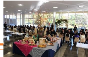
加賀商工会議所主催婚活イベントの様子

また加賀市内住宅地の土地を特別価格で社員に紹介し、地域に根付いた結婚につなげている。