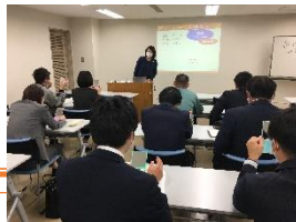
従業員ライフプラン支援講座の様子

財団から提供のある情報以外に民間の婚活イベント等の案内も対象の社員へ提供している。