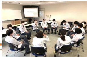
キャリアデザイン研修の様子

また、社内報で結婚した社員の 情報を発信することで、結婚に向 けた気運醸成につなげている。