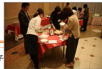
「恋活パーティー」の様子

当日のプログラムは、青壮年部と同組合の担当者が毎年のアンケート結果等を踏まえ、検討を重ねて決定している。特に「JAらしさ」を盛り込むことを大事にしており、「おにぎりグラム当てコンテスト」など自然と会話が生まれるプログラムを盛り込むことで、参加者同士が打ち解けるよう心掛けた。