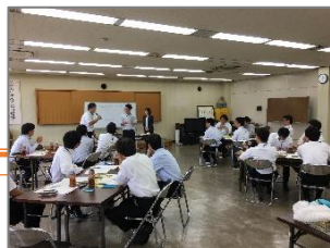
従業員ライフプラン支援講座の様子

その他の取組として、「いしかわ婚活応援企業」の輪を広げるため、同社が加入している事業協同組合の事務所に募集チラシを設置するなど広報活動を実施した。