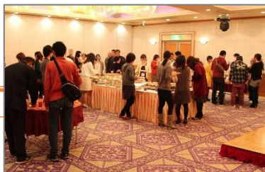
「恋活パーティ」の様子

企画内容については毎年のアンケート結果を踏まえ検討を重ねることで決定している。また他の婚活イベントと差別化を図るため、開催年によっては同組合の商品を参加者にプレゼントしたり、「ミニトマトすくい」をプログラムに盛り込むなど「JAらしさ」をアピールすることで集客を図っている。「恋活パーティ」の周知方法として、チラシ及びポスターをJA各支店や事業所に配付して掲示するなど、幅広く広報活動を実施した。