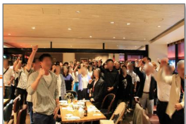
「感動Day」の様子（令和元年度）

その他の取組として、アドバイザーが自ら「縁結びist」となり独身男女の相談や支援をしやすい環境を整備している。また、グループ会社が運営するスーパー銭湯のイベントに従業員の家族も参加できる仕組みを作り、結婚して家族を持つことの良さを伝え機運醸成を図っている。