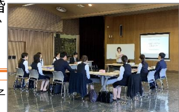
従業員ライフプラン支援講座の様子

その他の取組として、四半期に1度発行している庫内報「こうのう」において新婚従業員の紹介ページを設けている。単に「結婚しました」と掲載するだけでなく、該当職員の許可を得た上で写真や出会いのきっかけ、お互いへのメッセージ等も掲載することで、結婚の良さを伝え、機運醸成に繋げている。