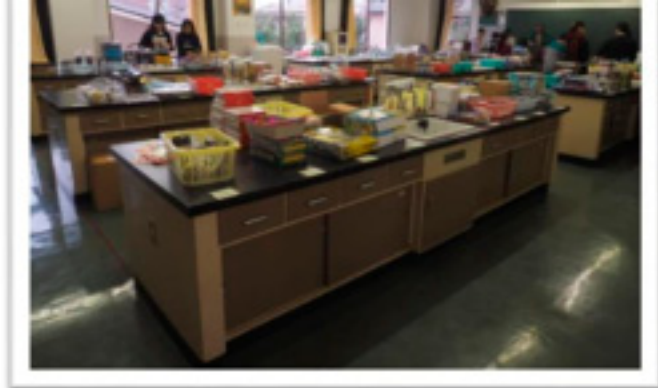
4 お店の看板も付けOK!