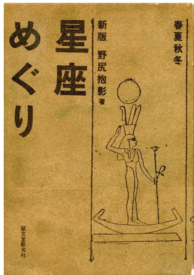
▲復刻版の新版星座めぐり 野尻抱影著 (絶版)